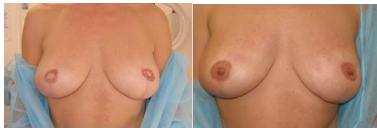
Fig. 1: Efficacia della dermopigmentazione

Le pazienti che hanno subito interventi demolitivi con asportazione del complesso areola-capezzolo per un tumore, per un trauma o per un problema congenito, continuano a provare un disagio psicologico anche a distanza di tempo. Diversi studi presenti in letteratura hanno dimostrato come la ricostruzione del complesso areola-capezzolo sia strettamente correlato al grado di soddisfazione della paziente e all'accettazione della propria immagine corporea aumentando sensibilmente il risultato ricostruttivo (Fig.1).